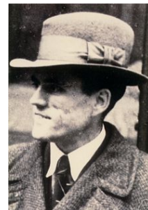
图 3: Gerhard Gentzen (1909 ~ 1945)