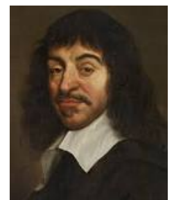
图 1: René Descartes (1596 ~ 1650)