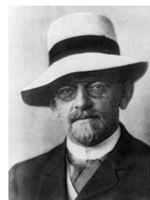
图 2: David Hilbert (1862 ~ 1943)

(a) \alpha \rightarrow (\beta \rightarrow \alpha)